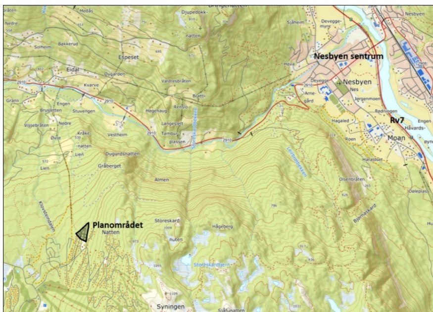
FIGUR 1: KARTUTSNITT SOM VISER PLANOMRÅDETS BELIGGENHET I FORHOLD TIL NESBYEN SENTRUM.

Oppdragsgiver for planarbeidet er Nesfjellet Prosjektutvikling as.