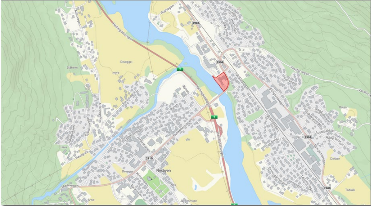
KARTUTSNITT SOM VISER PLANOMRÅDTS BELIGGENHET I FORHOLD TIL NESBYEN SENTRUM.