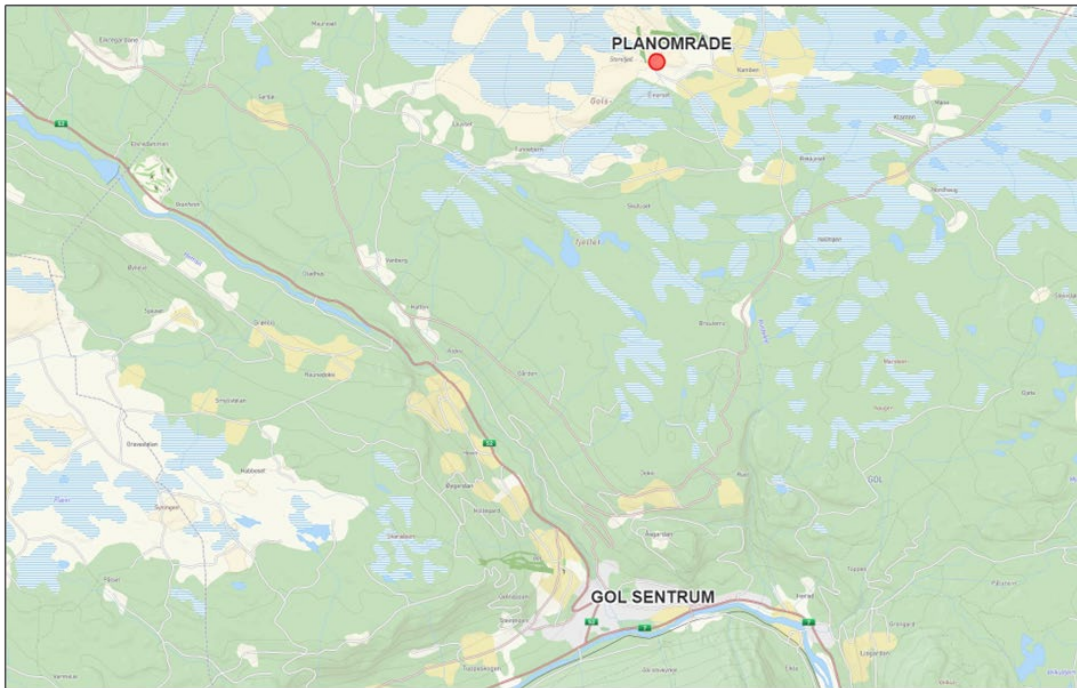
KARTUTSNITT SOM VISER PLANOMRÅDETS BELIGGENHET I FORHOLD TIL GOL SENTRUM.